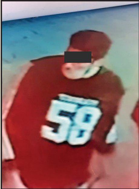
تصویر متهم بعد از دستگیری