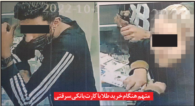
متهم هنگام خرید طلا با کارت بانکی سرقتی

به همین دلیل گروهی از کارآگاهان به سرپرستی ستوان یکم شفیعی (افسر پرونده) به واکاوی دقیق ماجرای سرقت‌های «جغد سیاه» پرداختند که نتیجه این بررسی‌ها مشخص کرد: متهم مذکور در شهرهای چناران، فریمان، تپه‌سلام، ملک‌آباد، تربت‌حیدریه و گلپه‌ار نیز با همین شگردها به حساب بانکی شهروندان دستبرد زده است. اما با توجه به پرونده‌های دیگری که در سیستم نیروی انتظامی به ثبت رسیده است، کارآگاهان تحقیقات گسترده‌ای را با دستورات ویژه قاضی نظری برای کشف سرقت‌های احتمالی دیگر او در شهرهای خراسان شمالی مانند شیروان و فاروج نیز آغاز کرده‌اند. گزارش روزنامه خراسان حاکی است: در حالی که اعترافات متهم از ۳۸ فقره سرقت کارت‌عابر بانک و دستبرد به حساب بانکی مردم حکایت دارد، تاکنون حدود ۲۸ شاکی شناسایی شده‌اند. اما تحقیقات پلیس با توجه به مسدودسازی تعداد زیادی از حساب‌های بانکی طلافروشان و کسبه‌ای که بدون دقت در مشخصات صاحبان حساب موجب تسهیل در ارتکاب جرم شده‌اند، بیانگر آن است که «جغد سیاه» با همدستی یک زن جوان، کالاهای بیشتری را با کارت‌های بانکی سرقتی خریداری کرده‌اند. به همین دلیل مقام قضایی به فروشنده‌گان کالا و به ویژه طلافروشان توصیه کرد: حتما هنگام فروش کالا یا طلا، مشخصات حساب بانکی و خریدار را با دقت بررسی کنند چرا که در این گونه‌پرونده‌ها حساب بانکی فروشنده‌گان کالا تا تکمیل تحقیقات قضایی مسدود خواهد شد و فروشنده‌گان کالا باید پاسخگوی قصور خود باشند.