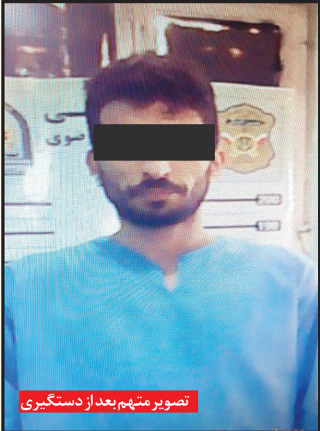
تصویر متهم بعد از دستگیری

بانکی آن‌ها، این مبلغ را از کارت بانکی خودشان به طور نقدی دریافت کنند و به او بپردازند! هنگامی که طعمه به خاطر نوع دوستی و احساسات و عواطف انسانی، کارت بانکی خود را در محفظه دستگاه خودپرداز قرار می‌داد، دزد سابقه‌دار مانند یک «جغد» پشت‌سر طعمه خود می‌ایستاد و فقط به شماره‌های رمز چشم می‌دوخت که آن فرد با زدن کلیدهای روی دستگاه‌عابر بانک ثبت می‌کرد. «جغد سیاه» وقتی شماره‌های رمز کارت بانکی طعمه خود را به حافظه می‌سپرد، با بهانه‌های مختلف و شگردهای پیچیده دیگری مانند این که سقف انتقال پول او نیز دچار اشکال شده است و...، کارت بانکی طعمه خود را می‌گرفت و در یک چشم‌برهم‌زدن و با شیوه‌ای تردستی‌گونه کارت سوخته یا کارت هدیه شبیه کارت بانکی مال باخته را تعویض می‌کرد که از قبل در دست داشت، او