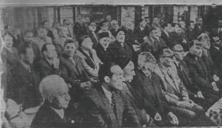
يك منظره از مدعوین در روز جشن افتتاح بانك بازرگانی شعبه مشهد در اطاق بازرگانی