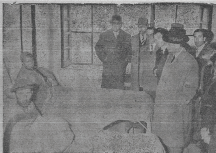
دو نفر از بیماران که در قسمت بیمارستان جنای میخانه بستری هستند «رجوع شود به صفحه دوم»