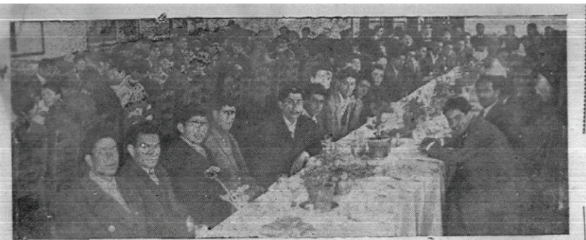
ورزشکاران شهرستانهای سبزوار - تربت - گاشمر - قوچان - در مجلس نهار که از طرف ریت بدنی خراسان داده شد - ورزشکاران در محل دانشسرای پسران در سر میز دیده میشوند

کتاب تاریخ «پیدایش مشروطیت ایران» تألیف آقای ادیب هروی منتشر شد طالبین بکتانفروشی های معتبر مراجعه نمایند ۳-۱ تیر ۱۴۵۷