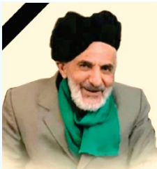
سومین سال درگذشت پدري مهريان و همسري دلسوز شادروان حاج سید علی سید علی زاده را گرامی می داریم. روحش شاد و یادش گرامی باد هزینه مراسم سالگرد صرف امور خیریه می شود. خانواده سید علی زاده

استاندار خراسان جنوبی از اختصاص ۱۸ میلیارد تومان تسهیلات زنجیره گوشت قرمز ویژه دام عشایر در استان، به ازای هر دام سبک ۷۰۰ هزار تومان و هر دام سنگین یک میلیون و ۵۰۰ هزار تومان خبر داد. دکتر قناعت با اعلام این خبر در جمع عشایر نهبندان و با اشاره به برنامه های سفر به نهبندان اظهار کرد: بازدید از بازارچه مرزی دو کوهانه،