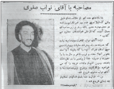
۱۳۳۲ - مصاحبه روزنامه خراسان با شهید نواب صفوی در «مهدیه» که مرکز فعالیت انجمن پیروان قرآن بود

که شهید نواب صفوی ویرانش در جمعیت فدائیان اسلام، به دلیل وابستگی برخی هیئت های مذهبی سنتی به روحانیان درباری، قادر به استفاده از ظرفیت آن ها نبودند، «انجمن پیروان قرآن» امکانات خود را در اختیار آن ها گذاشت و حتی شهید نواب صفوی هنگام مسافرت به مشهد، گاه همزمان «انجمن پیروان قرآن» می شد و سخنرانی های خود را در اماکن وابسته به این انجمن ایراد می کرد. فضل... فرخ، یکی از علاقه مندان به جمعیت فدائیان اسلام در مشهد و از اعضای «انجمن پیروان قرآن»، درباره ارتباط انجمن با این جمعیت می گوید: «وقتی قرار شد فدائیان اسلام به مشهد تشریف بیاورند، میزبان آن ها انجمن پیروان قرآن شد. مقدماتی برای