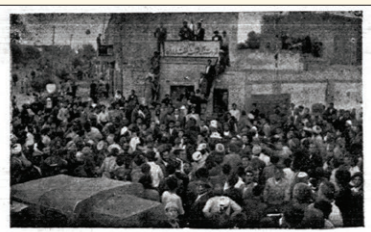
خرداد ۱۳۳۰ - حمایت مردم مشهد از آیت‌ا... کاشانی