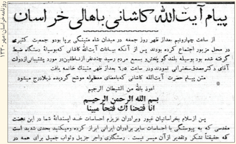
روزنامه‌خراسان، مهر ۱۳۳۰