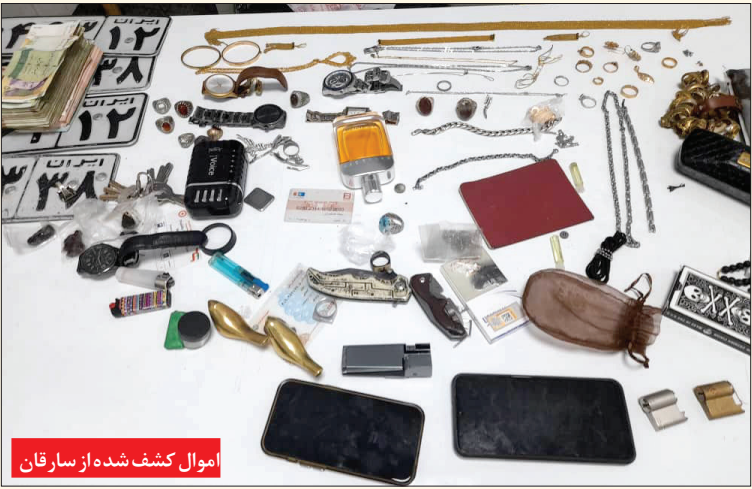
اموال کشف شده از سارقان