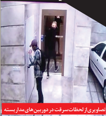
تصویری از لحظات سرقت در دوربین های مدار بسته

های مذکور را آغاز کنند. بنابر این گروه ویژه عملیاتی با بررسی محیط جغرافیایی محل های وقوع جرم و کنکاش در پرونده های سرقت به نتایجی دست یافتند که نشان می داد سارقان به اموال با ارزش مانند طلا، سکه و زیورآلات دستبرد زده و گاهی نیز درهای ضد سرقت را در مناطق شهری تخریب کرده اند. گزارش اختصاصی روزنامه خراسان حاکی است، با جمع اطلاعات، جلسات کارشناسی زیر نظر سرهنگ محمدرضا افتخاری (رئیس اداره عملیات ویژه آگاهی) تشکیل شد و کارآگاهان