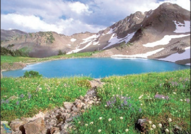
چشمه سبز گلبهار

و دین‌دار، به منطقه گلبهار آمد و دستور داد که آب چشمه گیل‌اس در ۲۳ کیلومتری این مکان را در جنگ جهانی دوم. نظامیان شوروی که از محور نمی‌توان همه آن‌ها را در این مختصر گنجانده؛ رویدادهایی مانند عبور ستون نیروهای متفقین در طی جنگ جهانی دوم. نظامیان شوروی که از محور نمی‌توان همه آن‌ها را در این مختصر گنجانده؛ رسیدن به این شهر، از منطقه گلبهار و کنار چناران عبور کردند؛ اتفاقی که می‌شود آن را در بخشی از تاریخ سرگذشت این شهر گنجانده.