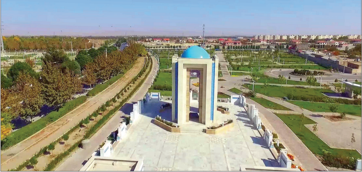
نمایی از شهر جدید در شمال خراسان

سکونتگاهی برای اقوام مختلف پیش از ورود آریایی‌ها به ایران و نیز، منزلگاهی برای کاروان‌های جاده راهبردی ابریشم، گوشه‌ای از سابقه تاریخی گلبهار است