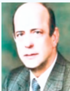
هرگز یاد تو از لوح دل و جان نرود

وی ادامه داد: به دولتی که می خواهد جراحی و به کشور خدمت کند، باید کمک کرد که این بیان صریح رهبر انقلاب است و آن هایی که مطیع رهبر انقلاب هستند باید این عبارت را بشنوند که کارهای امروز دولت کارهای بسیاری مهمی است و همه باید کمک کنند که دولت به این اهداف برسد.