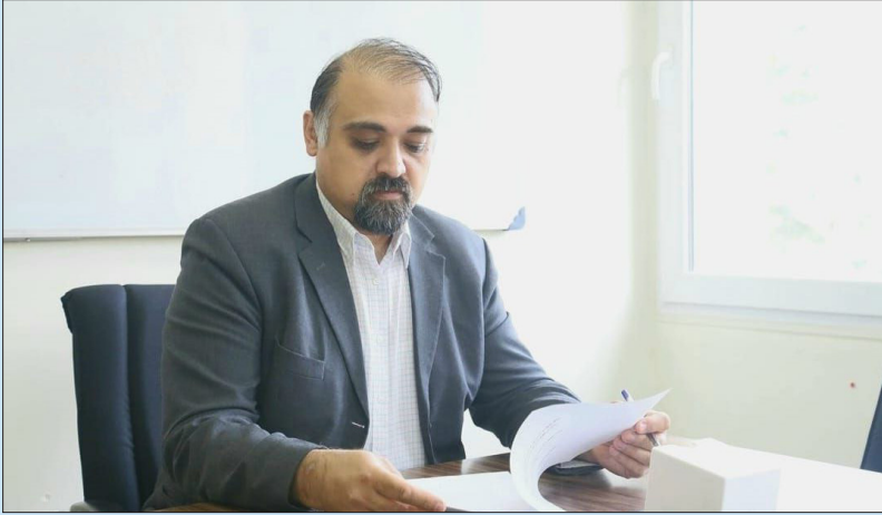
هشدار شهردار اصفهان