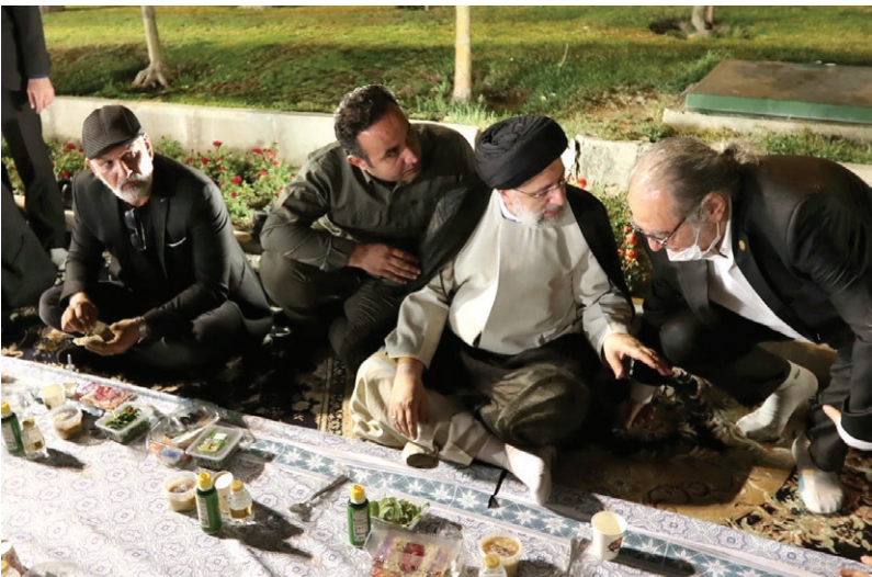
مراسم افطار رئیس جمهور با هنرمندان

رئیس جمهور: ۴ سال تورم ۴۰ درصدی، عامل اصلی گرانی هاست