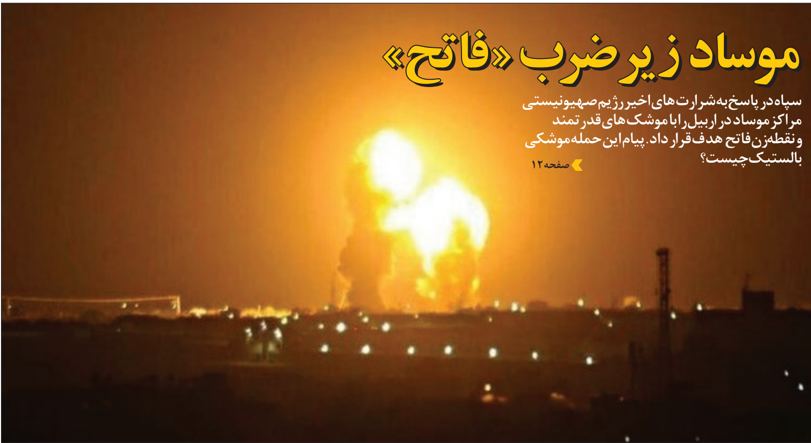
تصویر از روی فیلم گرفته شده است