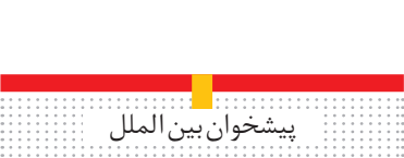
پیشخوان بین الملل