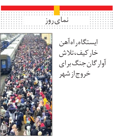
ایستگاه راه آهن

اکنون میست در یکی از کم سابقه‌ترین طراحی‌های تاریخ انتشار خود، بدون هیچ تیترو نوشته‌ای و تنها با تصویر کردن پرچم اوکراین که از میان آن خون می‌چکد، به این حوادث واکنش نشان داد. این مجله اما در مقاله‌های مربوط به بحران، تغییرات گسترده ژئوپلیتیک جهانی به خاطر این جنگ را بررسی کرده و همین‌طور در مقاله دیگری ایده اعلام ممنوعیت پرواز بر فراز اوکراین را نه تنها خطرناک بلکه بیهوده لقب داد.