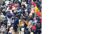
خروج از شهر