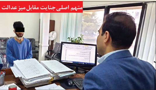
متهم اصلی جنایت مقابل میز عدالت

سجاد پور - به دنبال مرگ مشکوک جوان ۲۲ ساله ای که در مرکز غیر مجاز ترک اعتیاد بستری بود، همه معتادان و متصدیان از این مکان وحشتناک معروف به «قیصر» سراسیمه گریختند! به گزارش اختصاصی خراسان، ساعت ۱۸ روز گذشته، خبر مرگ هولناک جوانی در مرکز غیر مجاز ترک اعتیاد دهان به دهان پیچید تا این که پلیس در جریان قرار گرفت و بدین ترتیب نیروهای انتظامی عازم خیابان امام رضا (ع) در بولوار رسالت شدند. با کشف جسد جوان ۲۲ ساله ای که کف از دهانش سرازیر شده