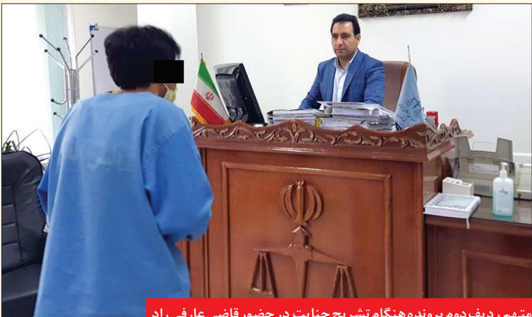
متهم ردیف دوم پرونده هنگام تشریح جنایت در حضور قاضی عارفی راد