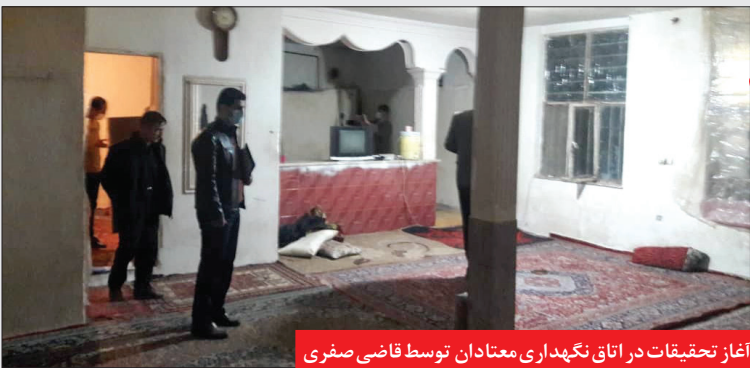
آغاز تحقیقات در اتاق نگهداری معتادان توسط قاضی صفری

خراسان، پس از انجام تحقیقات مقدماتی و با توجه به وضعیت بسیار اسفناک این مکان، قاضی ویژه قتل عمد، دستور پلمب را صادر کرد و مدیران و متصدیان نیز تحت تعقیب کارآگاهان پلیس آگاهی خراسان رضوی قرار گرفتند. این در حالی است که مسئولان قضایی و انتظامی همواره به شهروندان توصیه می کنند از معرفی معتادان به مراکز غیر مجاز خودداری کنند. اکنون نیز در آستانه تعطیلات نوروزی، قاضی دکتر صادق صفری از شهروندان خواست برای درمان افراد معتاد به مراکز قانونی مراجعه کنند یا با مراکز مشاوره و مددکاری در کلانتری ها راهنمایی بگیرند تا از وقوع چنین مرگ های دلخراشی جلوگیری شود.