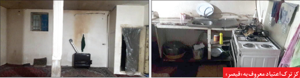
تصاویری از مرکز ترک اعتیاد معروف به «قیصر»