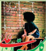
بزرگترین وبسایت مهدی کربلایی