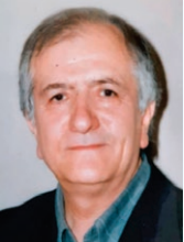
دوازدهمین سالگرد درگذشت