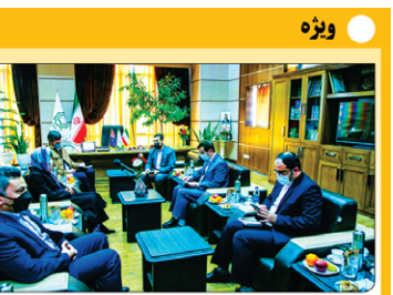
فرمانده سپاه استان قم

نیست با این حال با توجه به میزان حساسیتی که روی این مسئله وجود دارد، پیشنهاد حذف بند مربوط به مسدودسازی را مطرح کردیم. - پیشنهاد شفاف سازی خدمات پایه کاربردی را در آخرین نسخه داده ایم؛ این در حالی است که لیستی از این خدمات وجود دارد و این لیست