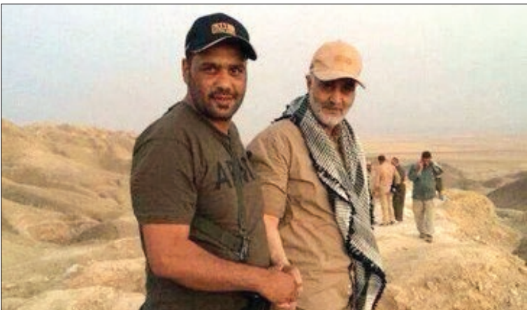
تصویری از حاج قاسم سلیمانی در پایان محاصره آمرلی

حاج قاسم که به استعداد جوانان مدافع شهر ایمان داشت، تصمیم گرفت به داخل شهر برود و به این نیروها روحیه بدهد تا محاصره شهر شکسته شود؛ در حالی که مدت‌ها بود شهر آمرلی امکان ارتباط با بیرون را نداشت. بنابراین با بالگرد متعلق به وزارت دفاع عراق به داخل شهر رفت. کسی فکرش را نمی‌کرد که از این بالگرد، حاج قاسم و ابومهدی پیاده شوند. خاطره جالبی که در مستند «۳۶۰ درجه محاصره» روایت می‌شود، این است که سردار مثنی خاک از زمین برداشت و گفت سری بعد نایستیم یا همه‌تان را آزادمی کنیم.