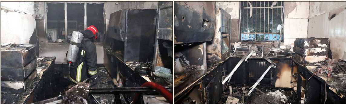
عکس ها از آتش سوزی

است که مسئولان ارشد آژمایشگاه معتقدند برخی از تجهیزات آژمایشگاهی که در این حادثه سوخته است، از دستگاه های مهم ونادر ارزیابی می شود که آژمایش های خاص توسط این تجهیزات صورت می گرفت. بنابر گزارش اختصاصی خراسان، بعد از وقوع این آتش سوزی وحشتناک، پرونده قضایی در این باره با اعلام شکایت مدیران آژمایشگاه شکل گرفت، اما با توجه به حساسیت ماجرا و برای رسیدگی تخصصی به پلیس آگاهی خراسان رضوی ارسال شد. طبق اطلاعات خبرنگار خراسان، این پرونده در اداره جنایی پلیس آگاهی زیر آتش را محققات رفته است و گروه ویژه ای از کارآگاهان ماموریت یافته اند با انجام بررسی های میدانی و صدهای دقیق اطلاعاتی، مرد نقیادار مرموز را شناسایی و دستگیر کنند. در همین حال نیز کارشناسان آتش نشانی پس از بررسی های تخصصی در کانون آتش،وقوع این حادثه را عمدی تشخیص داده اند.