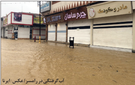
آب گرفتگی در رامسر

در همین حال فرماندار آمل دیشب گفت که به دلیل بارش سنگین برف و بوران در محور هراز و همچنین ریزش سنگ این محور تا اطلاع ثانوی مسدود است. علیرضا شریعت را فیک در محور