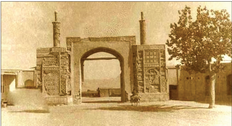
دروازه دلاب تهران، جایی که چاپخانه روزنامه وقایع اتفاقیه در نزدیکی آن قرار داشت