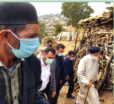
عالی ترین مقام اجرایی کشور را در کنار خود و در میان خود می بینند و بدون واسطه با او در دلد می کنند.

صفحات ۱۰ و ۱۲ امروز هم ابعاد اقتصادی و سیاست داخلی و خارجی کارنامه ۱۰۰ روزه دولت سیزدهم بررسی شده است و البته این نکته را باید گفت که مطمئناً چه در این سه گزارش می خوانید، همه آن چیزی نیست که قابلیت بررسی و موشکافی داشته باشد و بدون تردید بسیاری از وزارتخانه ها، سازمان ها و نهادهای زیر مجموعه دولت، طی این مدت اقدامات و عملکردهایی داشته اند که مثبت و منفی آن قابل بررسی است و می تواند موضوع گزارش های متعدد دیگری باشد.