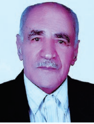
انا لله وانا اليه راجعون