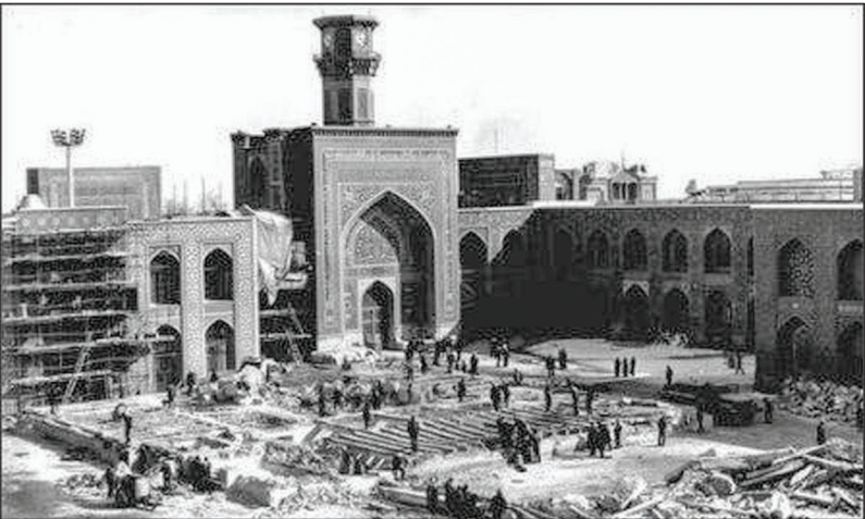
اواخر دوره قاجار و فعالیت های عمرانی در صحن عتیق