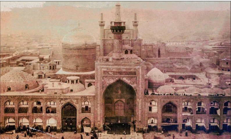
اواسط دوره قاجار – یکی از قدیمی ترین عکس های موجود از ضلع جنوبی صحن عتیق