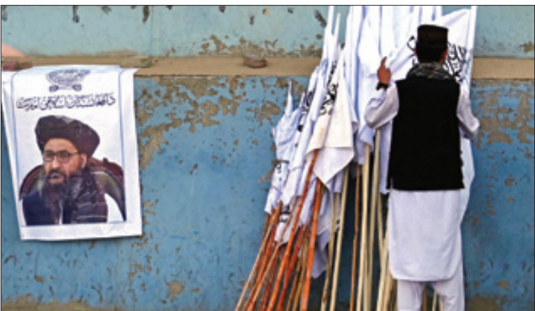
پنج‌شنبه ۲۵ شهریور ۱۴۰۰ صفر ۱۴۴۳، شماره ۲۰۷۵۵

دوران صدراعظمی آنگلارم کل پس از ۱۶ سال رو به پایان است. یک شیرینی‌پزی در وایل‌باخ در ستایش از هر کل، محصولی از خمیر بادام با طرح چهره‌او عرضه کرده‌است. البته تعداد شیرینی‌های تولیدشده تنها ۵۰۰ دانه است و هواداران پروپاقرص هر کل باید هرچه سریع‌تر بجنبند تا آن راتهیه کنند. این شیرینی را می‌توان به مدت دو سال نگهداری کرد و تاریخ انقضای آن مدت‌ها پس از پایان صدراعظمی هر کل خواهد بود. دوپچه‌وله