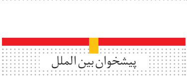
پیشخوان بین الملل