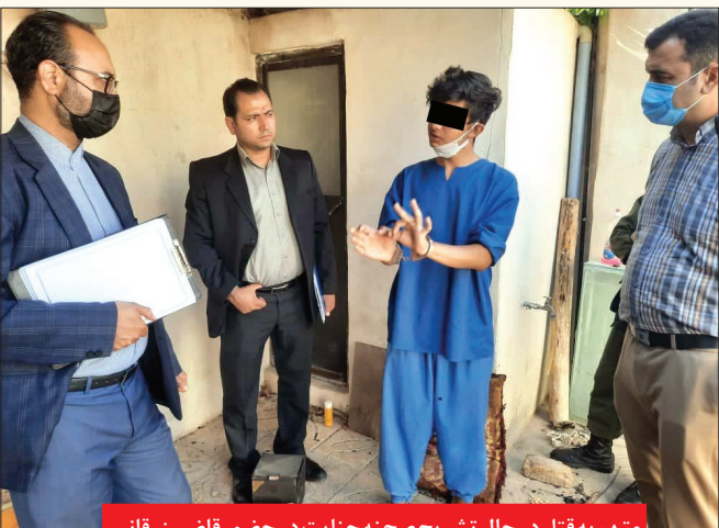
متهم به قتل در حال تشریح صحنه جنایت در حضور قاضی زر قانی

برادر مقتول: واقعیت تلخ این ماجرای هولناک را از طریق روزنامه خراسان متوجه شدیم!