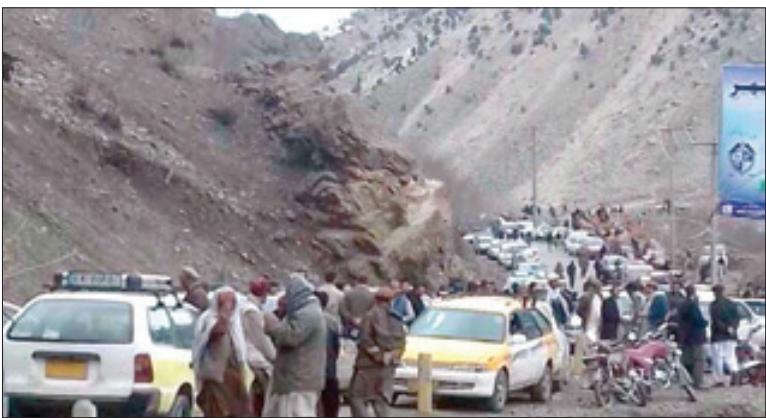
تصویری از ساکنان کوچالده شده پنجشنبه

عکس خبرگزاری فرانسه از تجمع زنان حامی طالبان در دانشگاه کابل