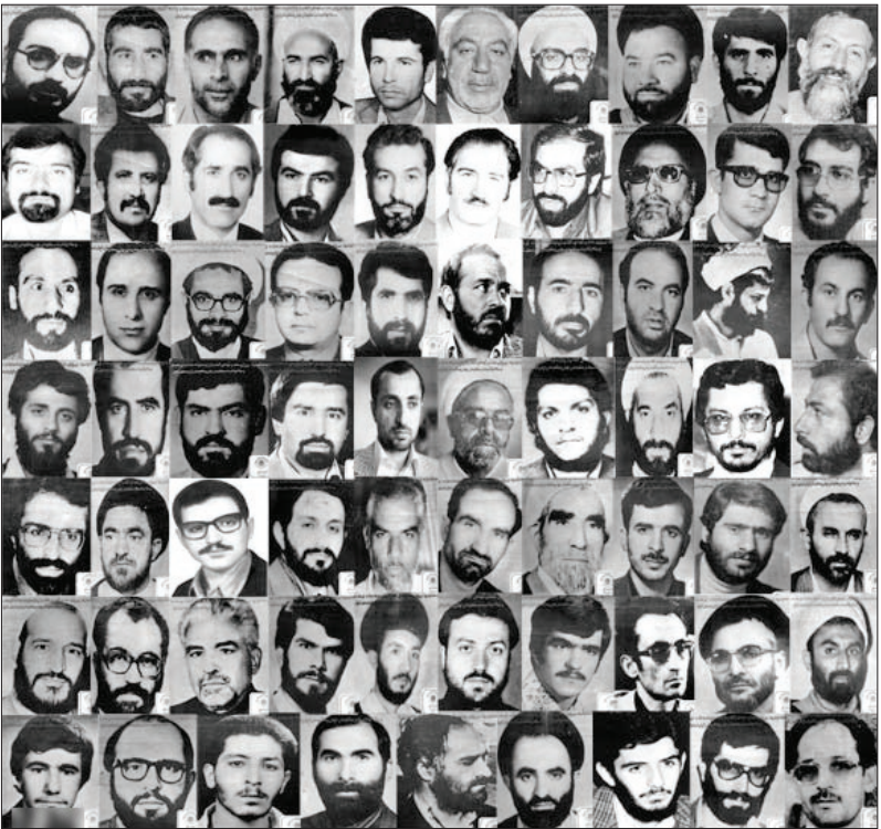
تعدادی از قربانیان ترور که به دست سازمان منافقین به شهادت رسیدند

یک بمب یازده پوندی ساخت که عوامل سازمان مجاهدین خلق در ۲۰ ژوئن ۱۹۹۴ (خرداد ۱۳۷۳) آن را در یکی از بزرگترین زیارتگاه های شیعیان در مشهد کار گذاشتند؛ حداقل ۲۶ نفر که بیشتر آن ها زن و کودک بودند در این ماجرا کشته و ۳۰ نفر مجروح شدند. این ارتباط تا بعد از حوادث ۱۱ سپتامبر و افتادن دوباره نام رمزی یوسف بر سر زبان ها فاش نشد؛ یعنی آمریکایی ها با علم به موضوع، حاضر نبودند اصل ماجرا را نقل کنند؛ تا این که «سیمون ریو»، نویسنده کتاب جنجالی «The New Jackals» (شغال های جدید) در متن کتاب خود با ارائه اسناد، از این راز پرده برداشت؛ هر چند که در هیاهوی آن روزها و بحبوحه جنگ خاورمیانه، کسی حواسش به انتشار این اطلاعات نبود. بنابراین قرار گرفتن سازمان منافقین در فهرست گروه های تروریستی، فقط یک فرایند برای وصل شدن آن ها به اربابان جدیدشان محسوب می شد. «آرون مرآت» می نویسد: «به فاصله چند سال، در ۲۰۰۹، انگلیس آن ها را از فهرست گروه های تروریست خارج کرد و در سال ۲۰۱۲ دولت اوپاما نیز، چنین کاری انجام داد؛ اما مجاهدین خلق آشکارا مشی خود را تغییر نداده بودند؛ آن ها همچنان فعالیت های تروریستی گسترده ای داشتند،