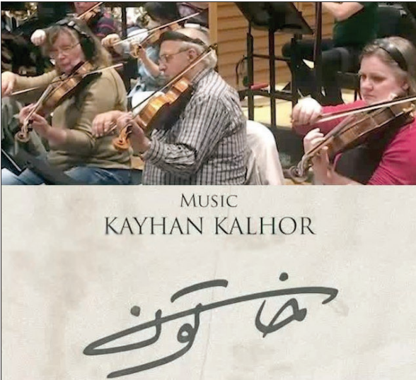
کلهر موسیقی «خاتون» را در پراگ و با همکاری ارکستر فیلارمونیک این شهر تولید کرده است

اشغال ایران توسط متفقین را روایت می کند. فضای این سریال که به هشتاد سال قبل برمی گردد، ظرفیت خوبی برای آهنگ سازی کلهر ایجاد کرده است؛ به طوری که در بعضی از سکانس ها موسیقی متن بر فیلم نامه برتری دارد. همچنین برخی از سکانس های این فیلم به واسطه حضور یک خواننده گیلانی، نیاز به آهنگ سازی مسلط به موسیقی اصیل ایرانی دارد. کیهان کلهر موسیقی این سریال را در پراگ با همکاری ارکستر فیلارمونیک این شهر تولید کرده و آدم کلمنز هبری آن را به عهده داشته است. میکس