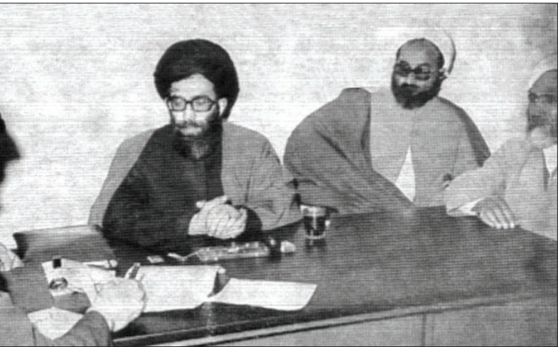
فروردین ۱۳۵۸ - تصویری از مصاحبه اختصاصی خراسان با حضرت آیت... خامنه‌ای

سفر هیئت اعزامی امام(ره) به سیستان و بلوچستان و سیمای دولت مکتبی و انقلابی پاسخ گفتند