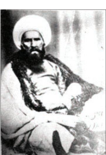
تصویر از حاج‌هادی سبزواری