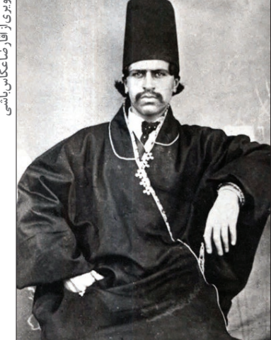
تصویر از شاه‌وهیراخان و لشکار گان