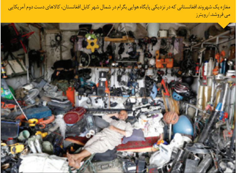
مغاز به شهروند افغانستانی که در نزدیکی پایگاه هوایی بگرام در شمال شهر کابل افغانستان، کالاهای دست دوم آمریکایی می فروشد.

نجات جان ۳۶۹ پناهجوی عازم اروپا در ساحل لیبی در دریای مدیترانه