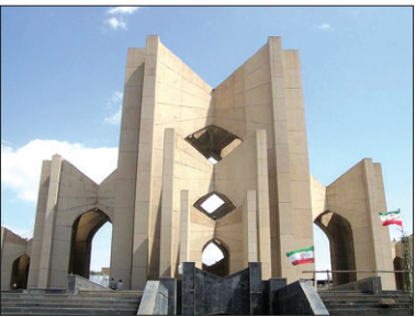
مزار خاقانی در تبریز

اوایل قرن ششم هجری بود که در جایی در شمال‌غربی این سرزمین به نام شروان (نواحی شمالی آذربایجان امروزی)، پسری به نام افضل‌الدین بدیل به دنیا آمد؛ پسری که از شغل پدرش که تجاری بود، هیچ خوش‌نمی‌آمد و با تشویق عمویش راه آموختن علم و ادب و دانش را در پیش گرفت و به یکی از شاعران و سرآمد زمانه‌اش بدل شد. او که بعدها با عنوان «تخلص خاقانی» مشهور شد، در طول زندگی‌اش همیشه آرزو داشت به خراسان سفر کند؛ هم از این جهت که بتواند بارگاه‌امام‌هشتم(ع) را زیارت کند و هم این‌که در هوای خراسان که مهد زبان فارسی و شعر و شاعری بود، با بزرگان شعر و ادب دیدار کند، اما هیچ‌وقت بخت و اقبال یاری‌اش نکرد و هر بار که به نزدیکی خراسان رسید، مشکل و مانعی سر راهش سبز شد. خاقانی نخستین بار در سال ۵۴۹ هجری راهی سفر به خراسان شد، اما از بخت بدش به‌ری که رسید، بیمار شد و والی همی‌رو او را از ادامه سفر منع کرد. خاقانی هم بناچار به شروان برگشت. او در قصیده‌ای به این ناکامی اشاره کرده و گفته: «چون نیست رخصه سوی خراسان شدن مرا / هم باز پس شوم نکشم بس بلای ری». در سال ۵۸۰ هجری قمری دوباره هوای سفر به خراسان به سر خاقانی زد و این بار تصمیم گرفت از راه طبرستان به خراسان برود و در این باره سرود: «از دربی به خراسان نکم رای دگر / که از ساحل خزران به خراسان یایم / سوی دریا روم و بر طبرستان گذرم / کافتخار طبرستان به خراسان یایم». اما این سفر هم هیچ‌وقت سرنگرفت و خاقانی در حسرت دیدار خراسان از دنیا رفت. این شاعر در چند قصیده دیگر از آرزوی سفر به خراسان سروده که مطلع مشهورترین آن‌ها این بیت است: «چه سبب سوی خراسان شدم نگذارند / عندلیم به گلستان شدم نگذارند».