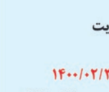
آستان قدس رضوی

که دارای رزومه مناسب در زمینه ساخت اینگونه مجموعه ها میباشند دعوت مینماید جهت دریافت اسناد ارزیابی حداکثر تا تاریخ ۱۴۰۰/۰۲/۲۸ به دبیرخانه معاونت عمرانی آستان قدس رضوی به نشانی مشهد، چهارراه شهدا، سازمان مرکزی آستان قدس رضوی معاونت عمرانی مراجعه یا با شماره تلفن ۰۵۱-۳۲۰۰۱۱۲۶ تماس حاصل نمایند. ضمناً هزینه چاپ آگهی در روزنامه ها بر عهده برنده مناقصه خواهد بود.