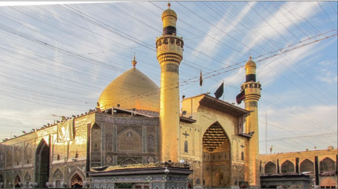
نخج، مسجد جمال زنجیر