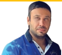
دلدار محسن چاوشی

سریال طنز «در دسر های عظیم» یکی از پر بیننده ترین سریال های ماه رمضان در دهه ۹۰ بود و البته تیتراژ آن، به اندازه خود سریال دیده نشد. میثم ابراهیمی که پیش از آن، تیتراژ برنامه «امروز هنوز تموم نشده» و «خانه فیروز های» را خوانده بود، آهنگ «چشم ما بستم» را برای تیتراژ پایانی این سریال خواند. ترانه سرای این آهنگ، حدیث دهقان و آهنگ سازی اش بر عهده فواد غفاری بود. کارهای میثم ابراهیمی در عرصه موسیقی همواره مورد توجه بوده است.