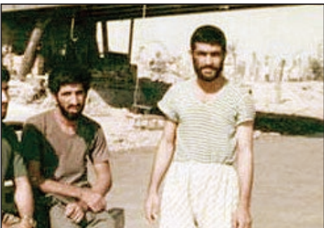
شهید رضاعلی عامل در کنار شهید مهدی میرزایی