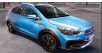
آریا محصول سایپا

در حدود ۲۵۰ تا ۳۵۰ میلیون تومان پیش بینی می شود. همان طور که گفته شد، آریا سایپا رقیب سر سخت دیگری در ایران خودرو دارد. جایی که از سال گذشته وعده رونمایی از k۱۲۵ داده شده اما تا کنون، خبری از آن نشده است. k۱۲۵ ایران خودرو نیز مانند آریا سایپا، در پلتفرم خود با سدان جدید این شرکت یعنی تارا مشترک است. این خودرو که به گفته برخی شباهت هایی با پژو ۲۰۰۸ دارد، احتمالاً با موتور TCV تولید و عرضه خواهد شد. همان موتور ۱۶۰ تا ۱۷۰ اسب بخاری که برای اولین بار روی دنا پلاس اتومات نصب شد و نسخه