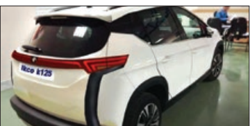
k۱۲۵ محصول ایران خودرو