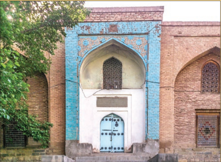
دورنمایی از مسجد جامع اردوباد که کتیبه شاه عباس بر فراز در آن آبی مشاهده می شود

و در مانده، گریختند و اعتبار اردوباد در حراست از مرزهای ممالک محروسه ایران، در تاریخ این سرزمین باقی ماند و بر کرانه‌ها «الحمد لاهب العطايا و الشکر خالق البرایا، اما بعد غرض از تسطیر این کلمات آنست که چون حقیقت اخلاص و جاسپاری