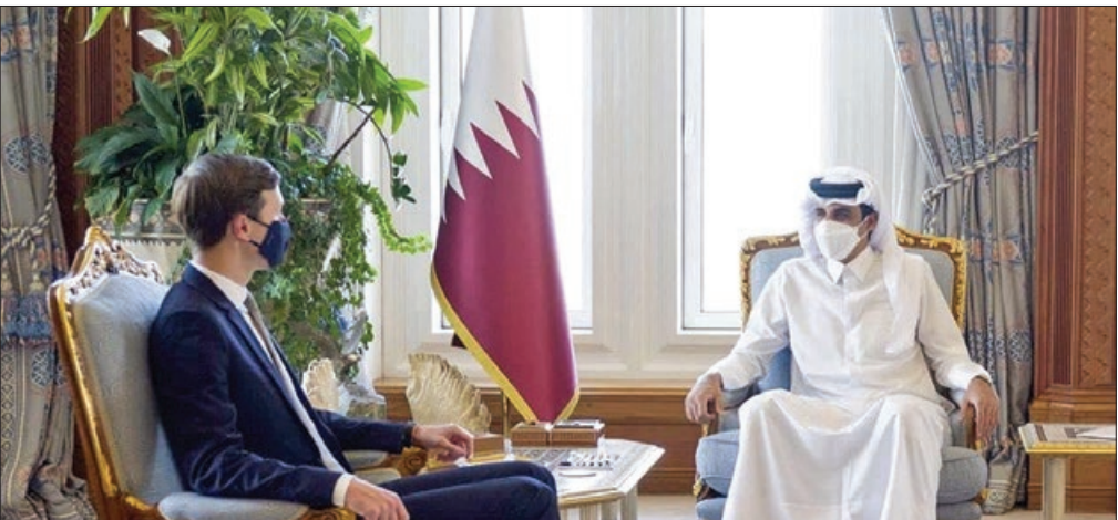
تصویری از دیدار داماد تراپ با امیر قطر

نخست: کوشنر در طول چهار سال گذشته هیچ اقدام جدی برای آشتی انجام نداده است. دوم: اگر واقعاً در صدد آشتی است چرا این سفر او شامل دیگر دشمنان فاعل مصر، امارات و بحرین نمی شود؟ سوم: تلاش برای حل اختلاف قطر و عربستان به دور از طرف های دیگر، کاشتن بذر جدایی در محور مخالف قطر است، مگر این که کوشنر باند عربستان می خواهد از ائتلاف امارات و مصر جدا شود به ائتلاف قطر و ترکیه بپیوندد که این احتمالاً بیانه نیست.