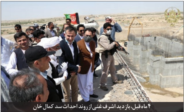
۴ ماه قبل، یازدید اشرف غنی از روند احداث سد کمال خان

■ تأخیر افغانستانی‌ها در تدوین سند راهبردی مشترک نکته مهم در این موضوع این است که ایران و افغانستان چند سالی است که تدوین یک سند جامع راهبردی بین دو کشور را آغاز کرده‌اند. پنج کمیته مسئولیت تدوین این سند را بر عهده دارند که یکی از آن‌ها، کمیته «آب» است که تمامی موضوعات مربوط به آب‌های رودخانه مشترک دو کشور در این کمیته بررسی و نهایی می‌شود. شکل‌گیری این کمیته یکی از اقدامات دیپلماتیک موثر بین دو کشور بوده که می‌تواند اختلافات موجود بر سر حقابه را حل و فصل کند اما متأسفانه به رغم پیگیری‌های مسئولان کشور ما برای نهایی شدن مباحث در این کمیته، تاخیرهای طرف مقابل مانع از به سرانجام رسیدن آن شده و این سند هنوز نهایی نشده است.