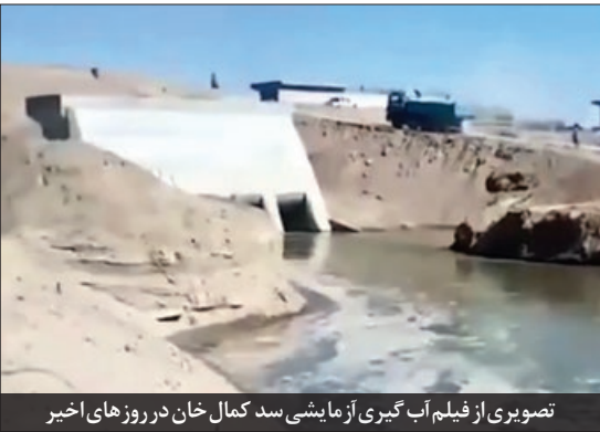
تصویری از فیلم آب‌گیری آزمایشی سد کمال خان در روزهای اخیر