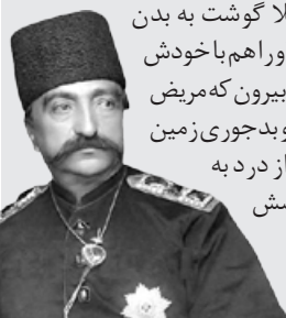
۲۵ آذر ۱۲۶۷