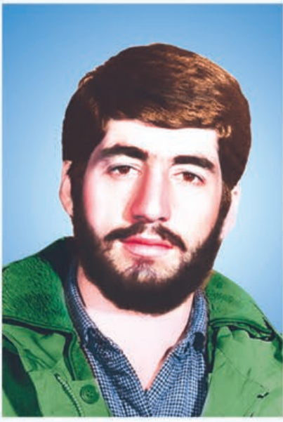
شهید حسن محمدزاده