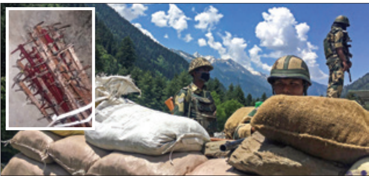
هند و چین به توسعه نظامی در منطقه مرزی لداخ ادامه می دهند

توثیت محمد البیختی عضو دفتر سیاسی جنبش انصار... یمن: با وجود این که جلوگیری از ورود نفتکش ها به بندر های یمنی جان همه مردم یمن حتی کودکان در مهد کودک ها را تهدید می کند، انگلیس هیچ اهمیتی برای آن قائل نیست اما طبق عادت، شتاب زده حملات دفاعی ما به عمق خاک عربستان را محکوم کرد. روزی خواهد رسید که انگلیسی ها نیز تاوان همه جنایت های خود را علیه مردم یمن خواهند پرداخت؛ آن ها در حالی تاوان این رفتار خود را خواهند داد که کاملاً خوار و ذلیل شده اند.