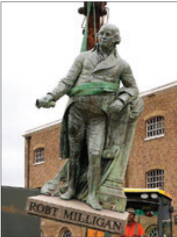
مجسمه‌های افراد نژادپرست قرن‌های گذشته است. در پی اوگیری جنبش ضدنژادپرستی

شهر دارلندن دستور بازنگری در مجسمه‌ها و نام خیابان‌های شهر را صادر کرد