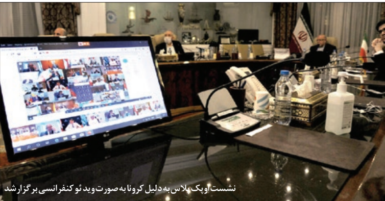
نشست اوپک پلاس به دلیل کرونا به صورت ویدئو کنفرانسی برگزار شد

چرا چشم انداز بازار جهانی نفت با وجود کاهش ۱۰ میلیون بشکه ای تولید و پیوستن آمریکا و چند کشور دیگر به توافق با اوپک پلاس، همچنان مثبت نیست؟