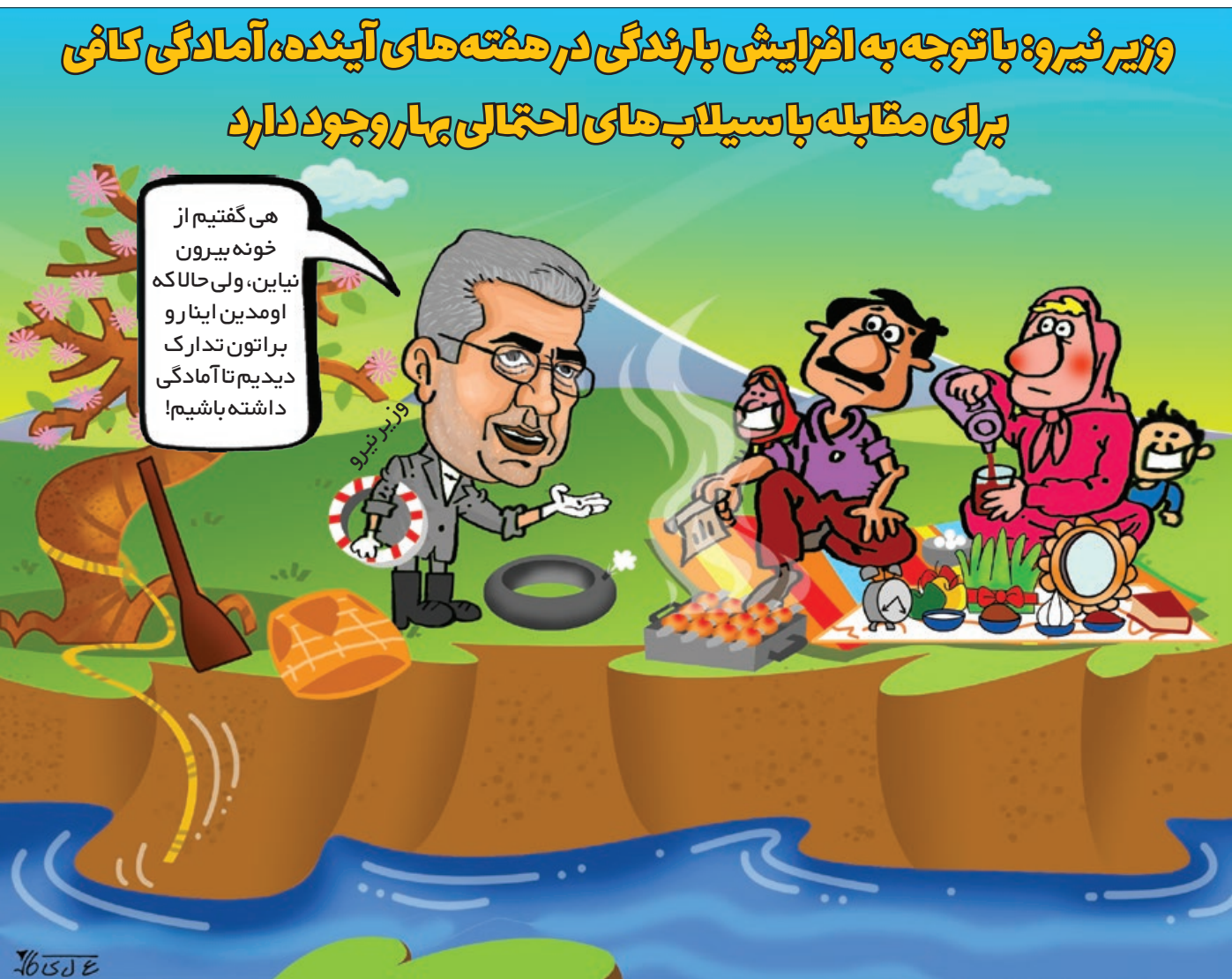
کار نویسند: علی کاشی

اما بعضی از کارهایی که هر سال انجام می‌دادیم تغییر نکرده و امسال هم به‌روال سال‌های گذشته قابل انجام است. مثل تماشای «استاد ایپ ۱» و «اسپایدر من» برای مصیبدمین بار از تلویزیون که هر سال همین موقع هم بخش مجدد می‌شود.