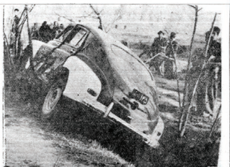
تاکسی که دیروز عصر دو نفر را زیر گرفت شرح در ستون اخبار مشهد