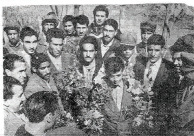
قهرمانان دو صحرای آفریدی که تهران رفته بودند مشهد مراجعت کردند، در عکس فوق قهرمانان و مستقبلین در خواجه اباصلت در حالیکه تاج گلها را به قهرمانان اهداء شده است دیده میشوند