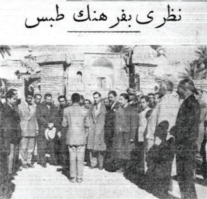
یک منظره از فرهنگیان طمس در حالیکه دانش آموزی خیر مقدم میگوید