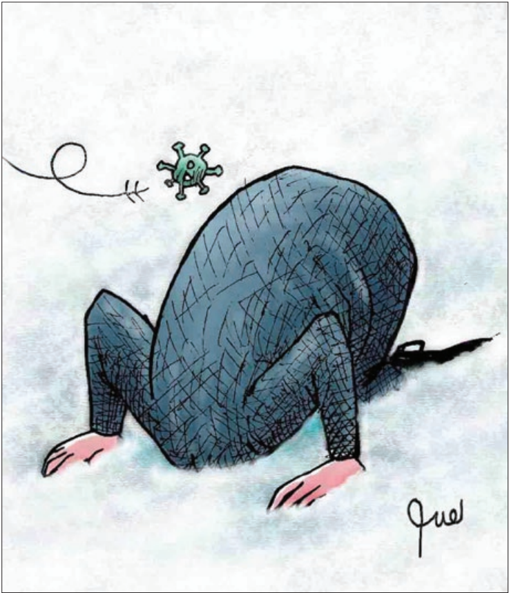
کار نویسند: حسین نقیپور