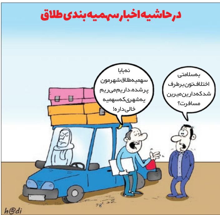
کار نویسند: هادی لکویان