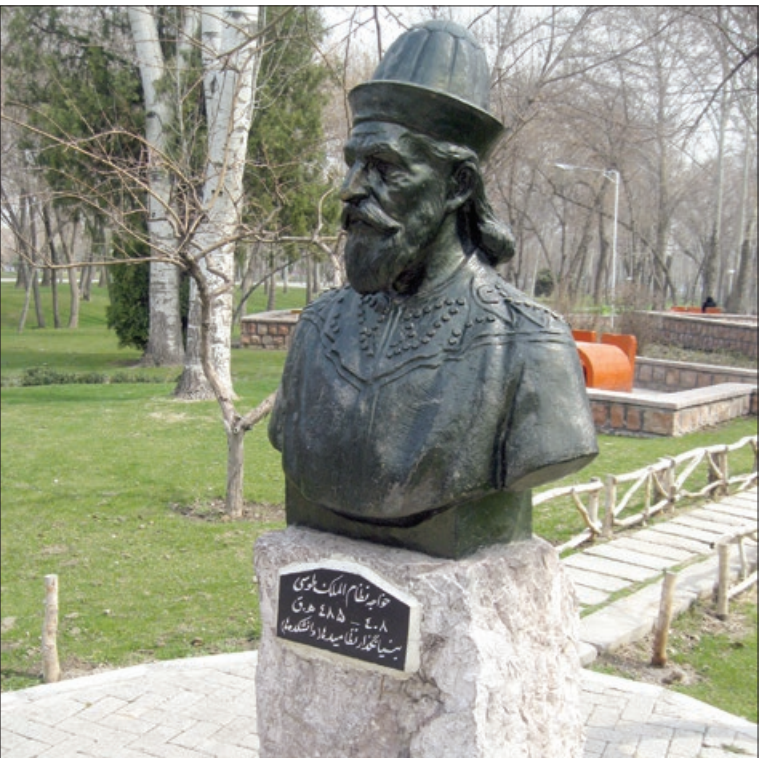
درپیش‌رو مجسمه خواجه نظام الملک در یونسنان ملت شهید