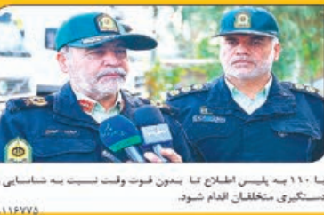
۱۶۰۰ به پلیس اطلاع تا بدون فوت وقت نسبت به شناسایی و دستگیری متخلفان شود.

فرمانده انتظامی استان قم از کشف انواع کالای قاچاق به ارزش بیش از ۲ میلیارد ریال در قم خبر داد. فرمانده انتظامی استان قم گفت: گویا عرصت‌کار پایگاه خبری پلیس، اظهار داشت: با تلاش مأموران پلیس آگاهی استان قم یک دستگاه کشفه تانکر بار حامل بار قاچاق که از یک استان جنوبی به مقصد تهران بارگیری شده بود، در جاده «قم-کرج» شناسایی و متوقف شد. فرمانده انتظامی استان قم افزود: در بررسی دقیق تر به این باره با یک میلیارد و ۲۰۰ میلیون ریال قاچاق و ۲۰۰ میلیون ریال متعلقه کشفه تانکر بار حامل «روغن سوخته» بوده است اما پس از شمارش کالا و مطلقه با اسناد ارائه شده ۶۶ کوفی حاوی ۲ هزار و