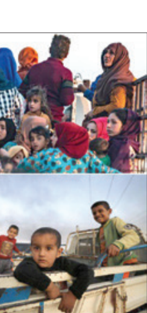
سازمان ملل: بیش از ۱۰۰ هزار نفر در شمال سوریه بی خانمان شده اند

مینیاپولیس صحنه در گیری هواداران و مخالفان ترامپ: پس از برگزاری گرد همایی انتخاباتی رئیس جمهور آمریکا در ایالت مینه سوتا، هواداران و مخالفان وی در خیابان های شهر مینیاپولیس با حضور گستره نیرو های پلیس تجمع کردند.