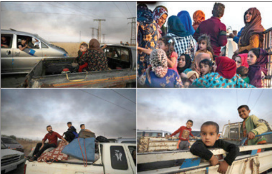
سازمان ملل: بیش از ۱۰۰ هزار نفر در شمال سوریه بی خانمان شده اند